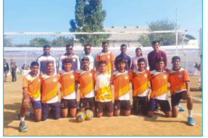
महाराष्ट्र राज्य आंतर विद्यापीठ क्रीडा महोत्सवात हॉलिबॉल स्पर्धेमध्ये रौप्यपदक विजेता संघ