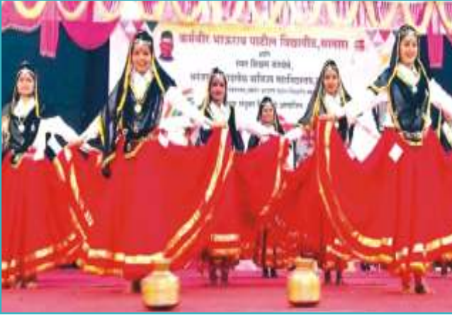
प्रथम युवामहोत्सवात लोकनृत्य सादर करताना विद्यार्थिनी