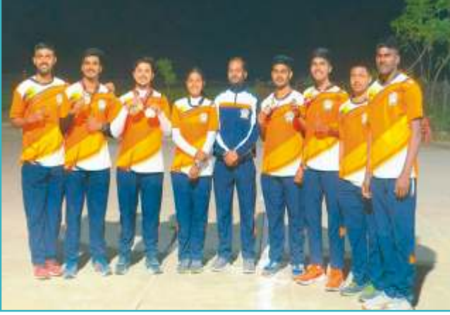
ऑल इंडिया इंटर युनिव्हर्सिटी आर्चरी स्पर्धेत सहभागी झालेला विद्यापीठातील मुली व मुलांचा संघ