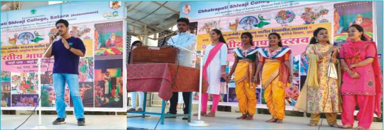
' भारतीय भाषा उत्सवा'त भारतीय विविध भाषेतून गायन, भाषण इत्यादी आविष्कार करताना विद्यार्थी, विद्यार्थिनी