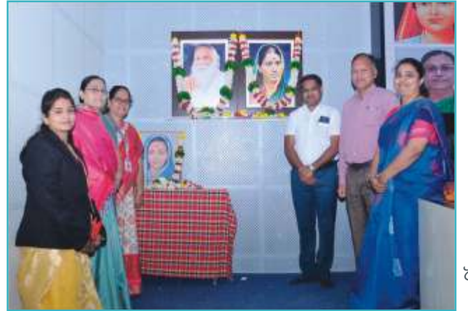
सावित्रीबाई फुले जयंती अभिवादन (लक्ष्मीबाई भाऊराव पाटील महिला सक्षमीकरण कक्ष)