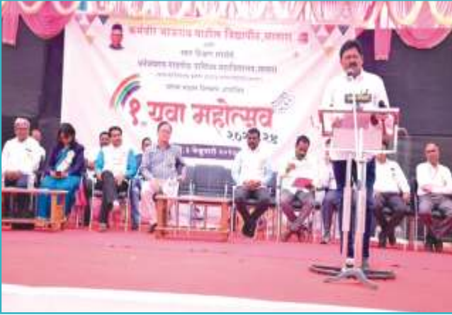
युवा महोत्सवात कलावंतांना मार्गदर्शन करताना मान्यवर