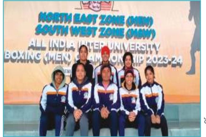
साऊथ वेस्ट झोन इंटर युनिव्हर्सिटी महिला बॉक्सिंग स्पर्धेत सहभागी झालेला मुलींचा संघ