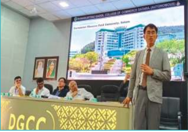
कोरियन भाषा अभ्यास आणि नोकरीच्या संधी संदर्भाने मार्गदर्शन करताना दक्षिण कोरिया येथील टॉगमाँग विद्यापीठातील मार्गदर्शक