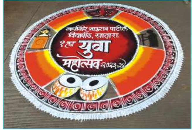
प्रथम युवामहोत्सवात आकर्षक रांगोळी रेखाटन