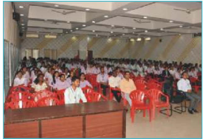
'करिअरच्या विविध संधी' कार्यशाळेत सहभागी झालेले विद्यार्थी-विद्यार्थिनी