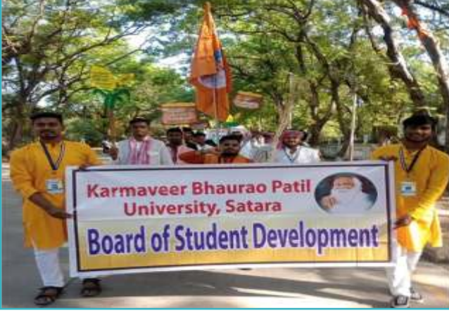
आंतरविद्यापीठ युवामहोत्सवात विद्यापीठाचे प्रतिनिधित्व करताना विद्यापीठाच्या विद्यार्थी विकास मंडळातील कलावंत विद्यार्थी